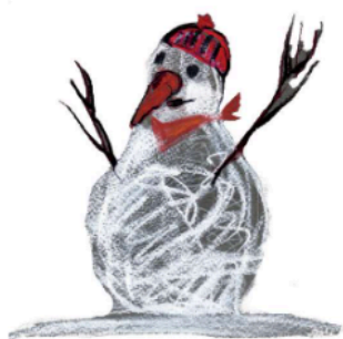
Omul de zăpadă